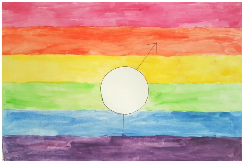
Elever i åk 5 har målat Prideflaggan och ritat ett tecken i mitten som kan stå för han, hon och hen.