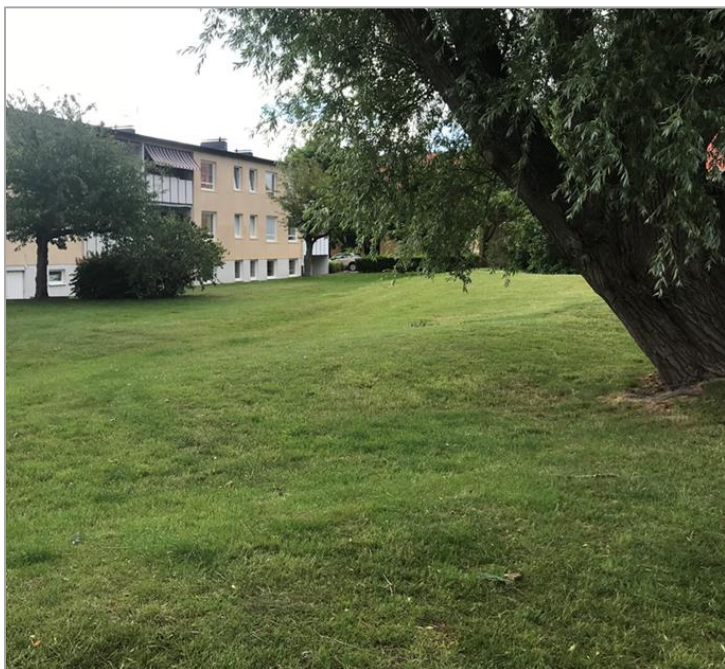
Figur 3. Provtagning av yttjord genomfördes i gräsytor inom Prytzparken.

Prytzparken utgörs av en lekplats, en bollplan och gräsytor, Figur 2 och Figur 3. Själva lekplatsen är beklädd med "löparbanematerial" och där kommer barn som leker där inte i kontakt med underliggande jord. Delproven till samlingsproverna Parken 1 och Parken 2 är uttagna i omgivande gräsytor och på bollplanen, Figur 3.