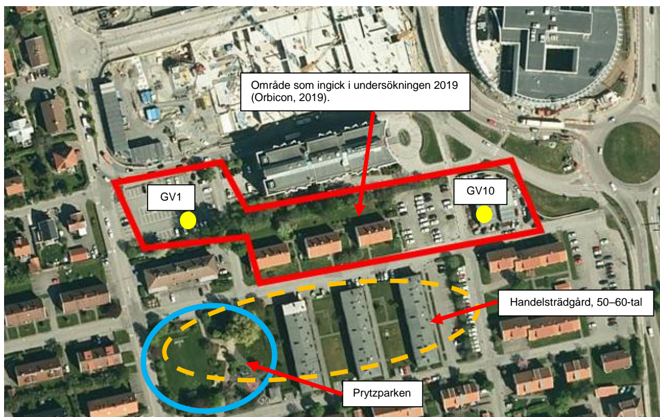
Figur 1. Illustration över redan provtaget område (rödmarkerat), inklusive läget för befintliga grundvattenrör samt läget för Prytzparken och den gamla handelsträdgården.

I samband med det fortsatta arbetet med detaljplanen har myndigheterna påtalat att det saknas provtagning inom Prytzparken, Figur 1. Det är framförallt förekomst av rester av bekämpningsmedel från den handelsträdgård som tidigare funnits inom området som bör utredas enligt Länsstyrelsen i Västra Götaland.