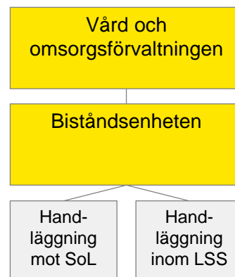
Figur 1. Organisationsschema

Inom vård- och omsorgsförvaltningen finns biståndsenheten. Biståndsenheten är uppdelad i två arbetsgrupper utifrån de som arbetar mot socialtjänstlagen (SoL) respektive lagen om stöd och service till vissa funktionshindrade (LSS). Socialtjänsthandläggarna är de som beslutar om bistånd kopplat till äldreomsorg. Biståndsenheten leds av en biståndschef. Förvaltningschefen har det övergripande förvaltningsansvaret över biståndsenheten och är chef över biståndschefen.